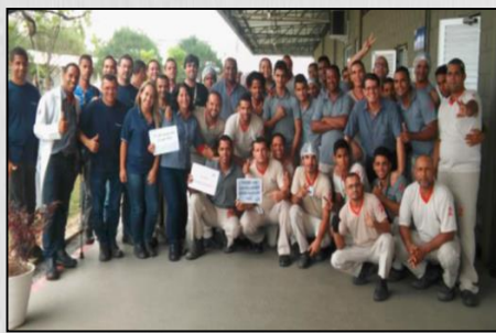
Equipe Pepsico Suape que recebeu treinamento FSSC 22000.

Com o objetivo de atender aos requisitos para a composição, formação, implantação e reciclagem de brigada de incêndio, preparando-a para atuar na prevenção e no combate ao princípio de incêndio, abandono de área e primeiros socorros, em janeiro de 2016 a Trino Frio realizou com seus brigadistas treinamento de Prevenção e Combate a Incêndio (PCI). Os treinamentos e simulações para formação e reciclagem de brigadistas são realizados conforme cronograma anual da Trino Frio e podem também ser agendadas por empresas interessadas. Maiores informações: 81-3243-8529 ou 81-98751-0903.