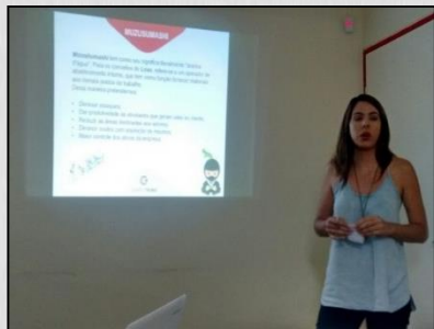
Reunião de apresentação de resultados Six Sigma .

Foram três projetos que viraram uma realidade, desafios que viraram rotina, Green Belts que aprimoraram processos internos do Grupo Trino objetivando reduzir desperdícios, melhorar a qualidade e aumentar a produtividade. O primeiro projeto visou a melhoria da produtividade na operação logística da Trino Frio e ajustou os custos operacionais e administrativos. Dessa forma, os indicadores de desempenho tiveram resultados bastante positivos. O segundo projeto aplicou a ferramenta de “5S” na sede do Grupo Trino, onde foi ajustado todo o estoque do Almojarifado Central e aplicado os 5 sensos em todos os Departamentos. Já o terceiro projeto utilizou a expertise do curso para reorganizar todos os Departamentos de forma que os processos internos fluíssem com mais eficiência e sem desperdícios.