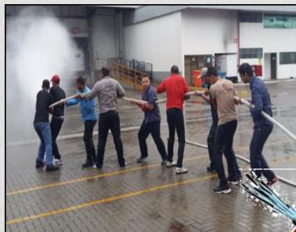
Simulação de combate ao princípio de incêndio.